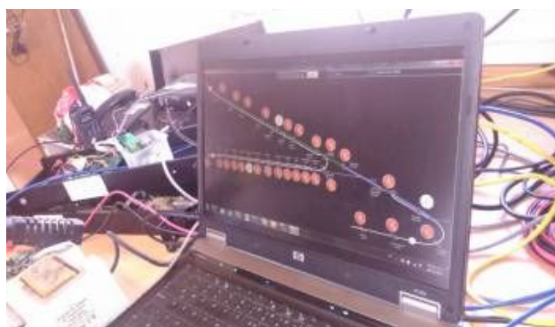
Figura 3.4.3: Imagen de la pantalla de usuario del sistema

3.4.9. El sistema monitorea un conjunto de 32 barreras y está organizado en dos consolas centrales de 16 puestos independientes entre sí. El sistema cuenta con equipos marca MOTOROLA modelo GM300 o SM120/125 que se utilizaran en las estaciones remotas y las consolas, el sistema prevé dos frecuencias